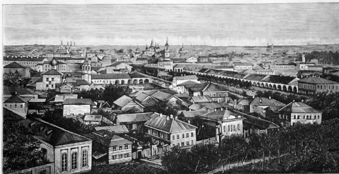
Видъ г. Вологды съ соборной колокольни.