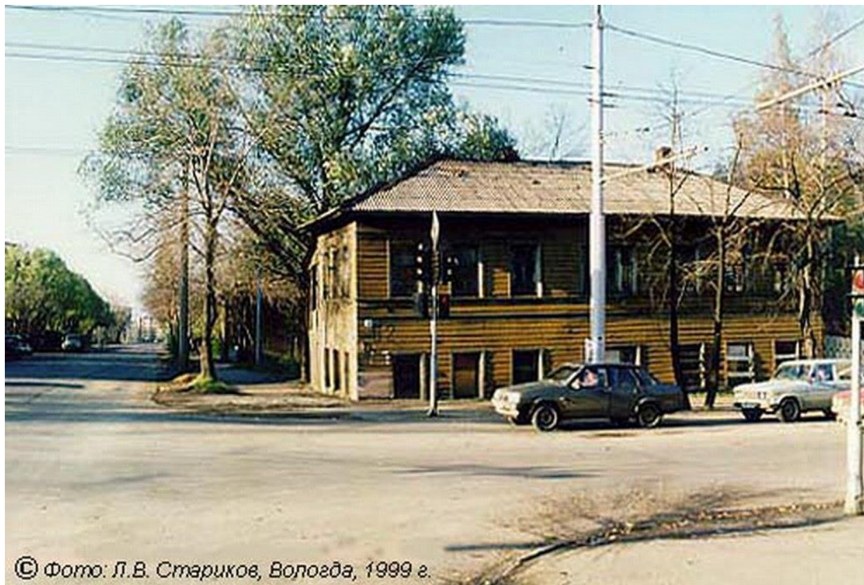
Вологда, 1999 г.