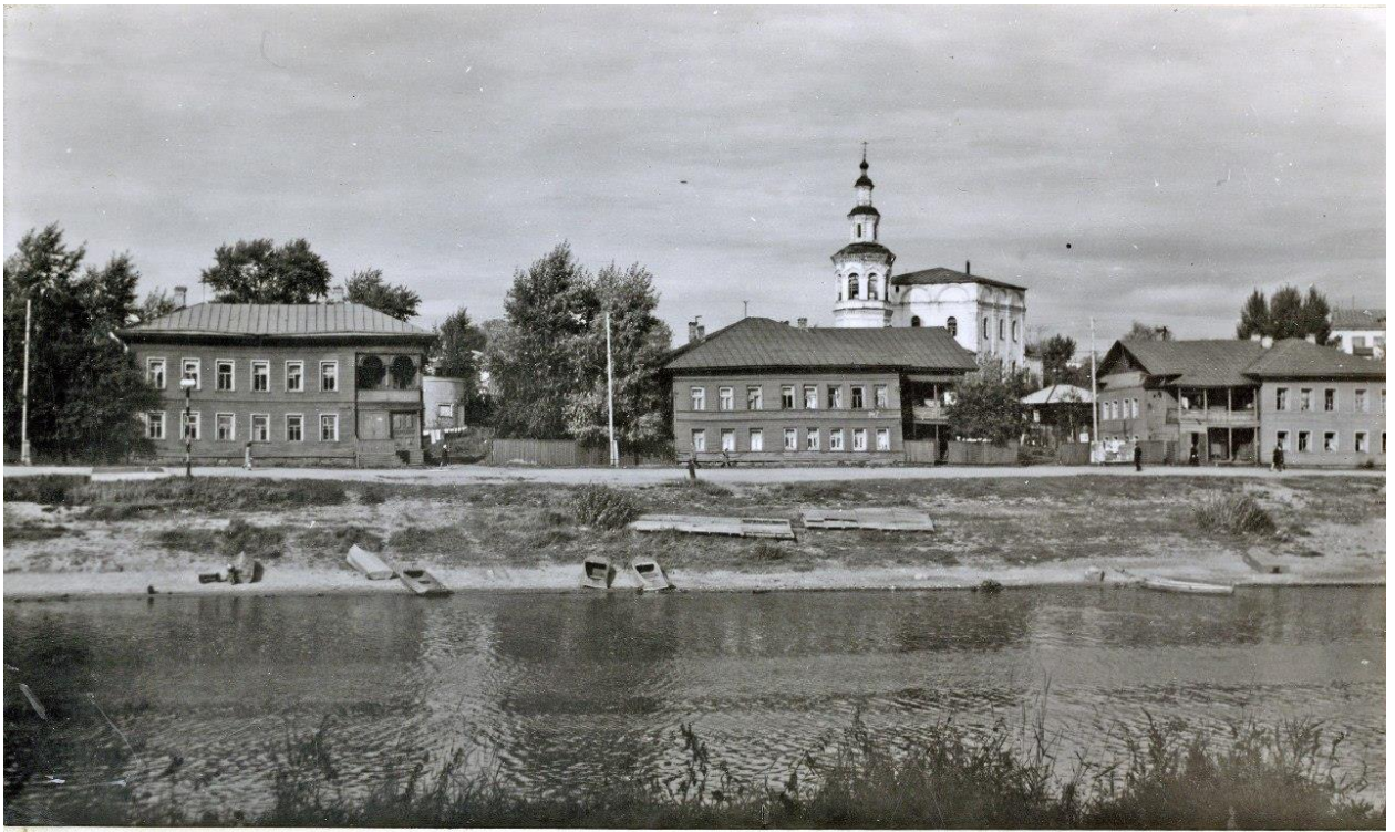
Набережная в Армии 1976 г. у Красного моста.

Окладная книга 1907-15 гг. (ГАВО ф. 475 оп. 1 д. 1668) фиксирует с ошибочным указанием местоположения домовладения: