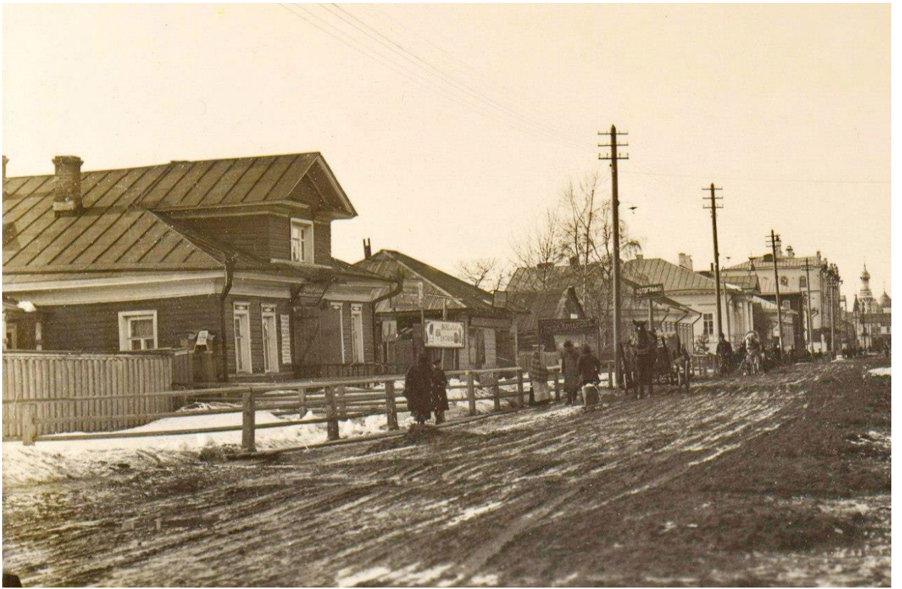
А дом И.Н. Суворова – не позднее 1858 года, в котором началось строительство 32-квартирного углового дома комбината «Вологдалес» (ул. Предтеченская 29):