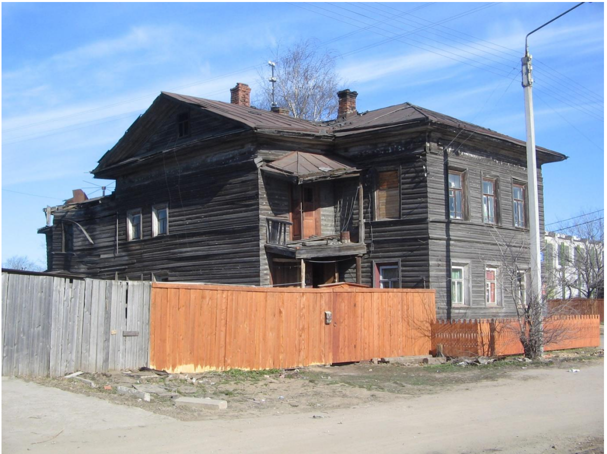
и фотографию несохранившегося дома по Пречистенской наб. 50: