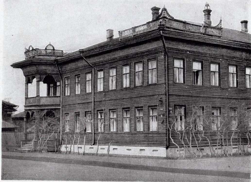
121. Один из многих домов в Вологде — образец северного деревянного зодчества на рубеже XIX—XX веков