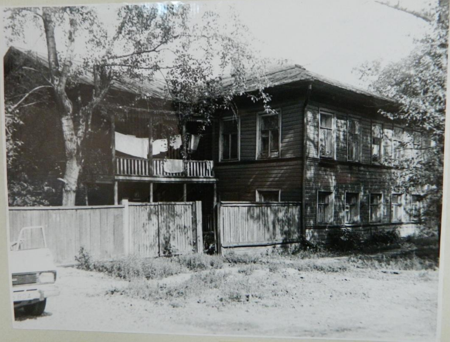
УЛИЦА ГОГОЛЯ, Д. 41