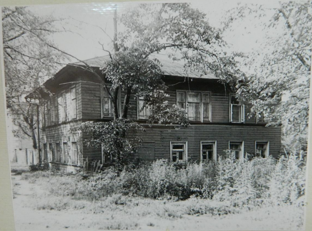
УЛИЦА ГОГОЛЯ, Д. 41